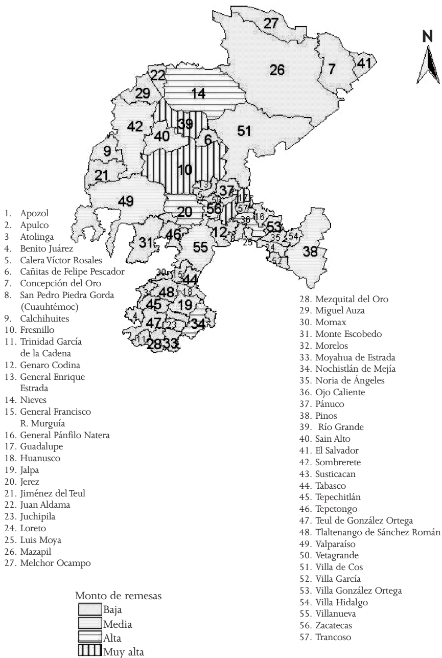
Remesas familiares. Año 2000 (pesos)

Fuente: con datos del cuadro 1A, se formaron 4 rangos excepto el municipio de Guadalupe, el cual se consideró como de muy alta recepción de remesas.