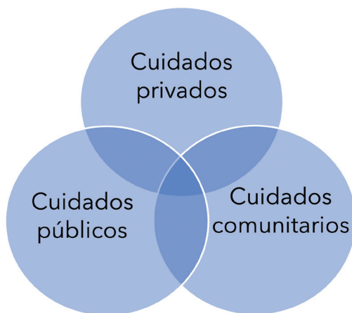
Figura 2. Tipos de cuidado en sociedades con sistemas de cargos

Así, los tipos de cuidados que llevan a cabo las mujeres indígenas en el espacio privado se entrelazan con los cuidados comunitarios (véase figura 2), en los que tienen la responsabilidad del bienestar, ya sea bajo una estructura laboral, como es en el caso de las profesoras o enfermeras, o de la estructura político-administrativa de los sistemas de cargos. De esta forma, esta triada ratifica complejos procesos de desigualdades de género.