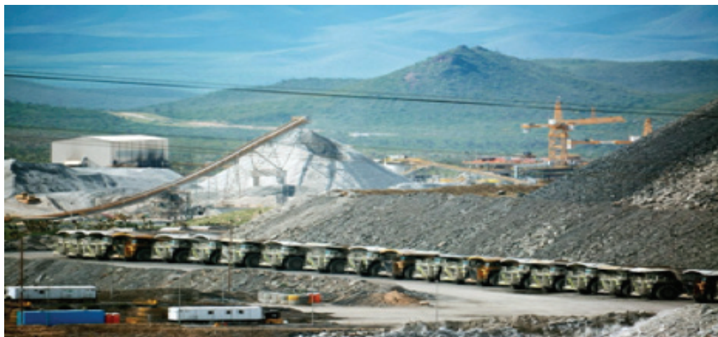
Figura 2. Minera Peñasquito de Newmont-Goldcorp en Mazapil