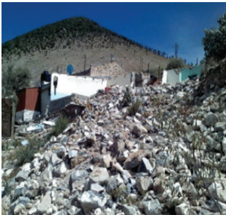
Figura 5. Viviendas destruidas en Salaverna