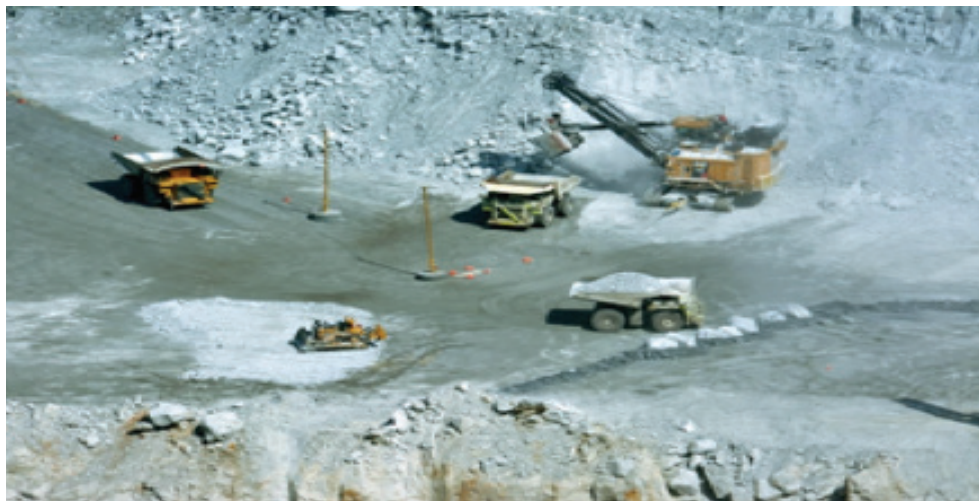
Figura 3. Mina a cielo abierto, el saqueo vigente. Trabajos realizados por maquinaria pesada en la mina Peñasquito, ubicada en Mazapil, Zacatecas