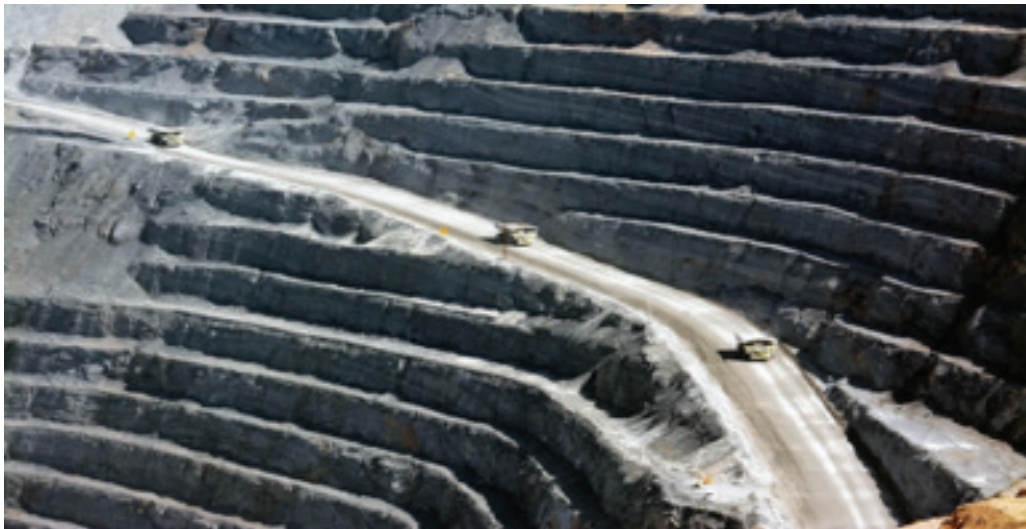
Figura 4. Nuevo auge de la minería de oro en Zacatecas. Tajo de la mina Peñasquito, ubicada en Mazapil