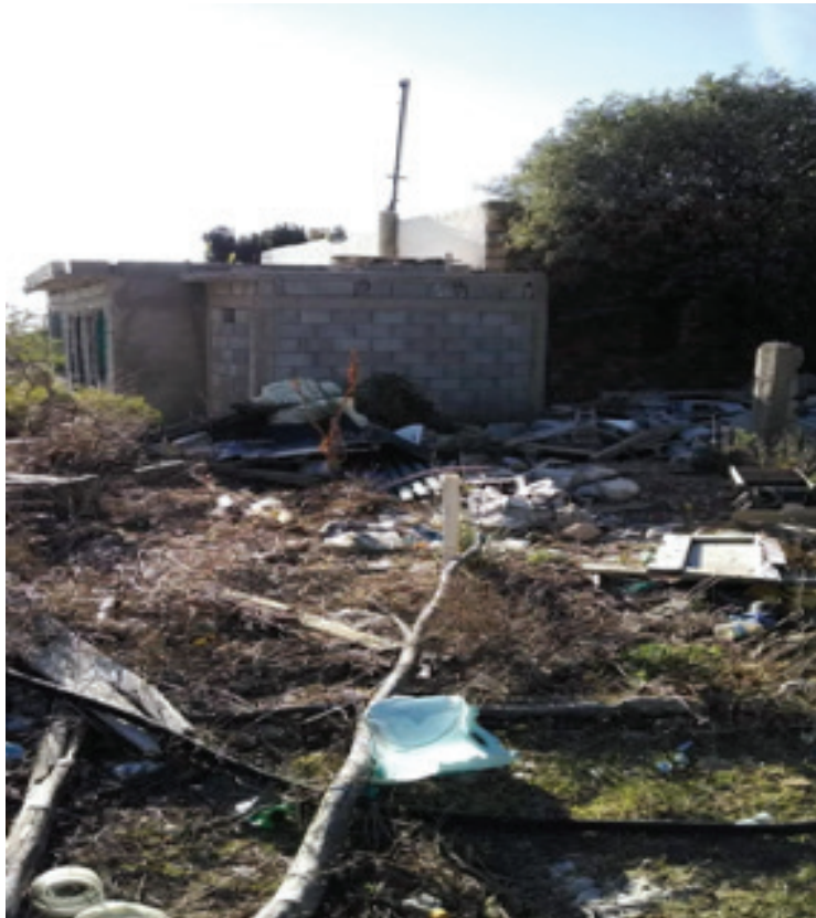
Figura 6. Vivienda destruida en Salaverna