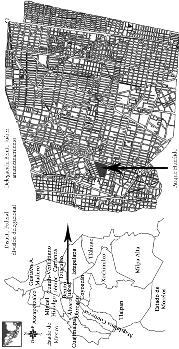
Figura 1 Ubicación del parque Hundido en la Delegación Benito Juárez del Distrito Federal