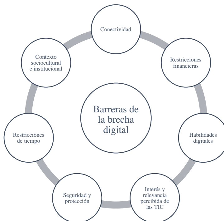
Figura 2. Las barreras para adoptar y usar las TIC en los países en desarrollo