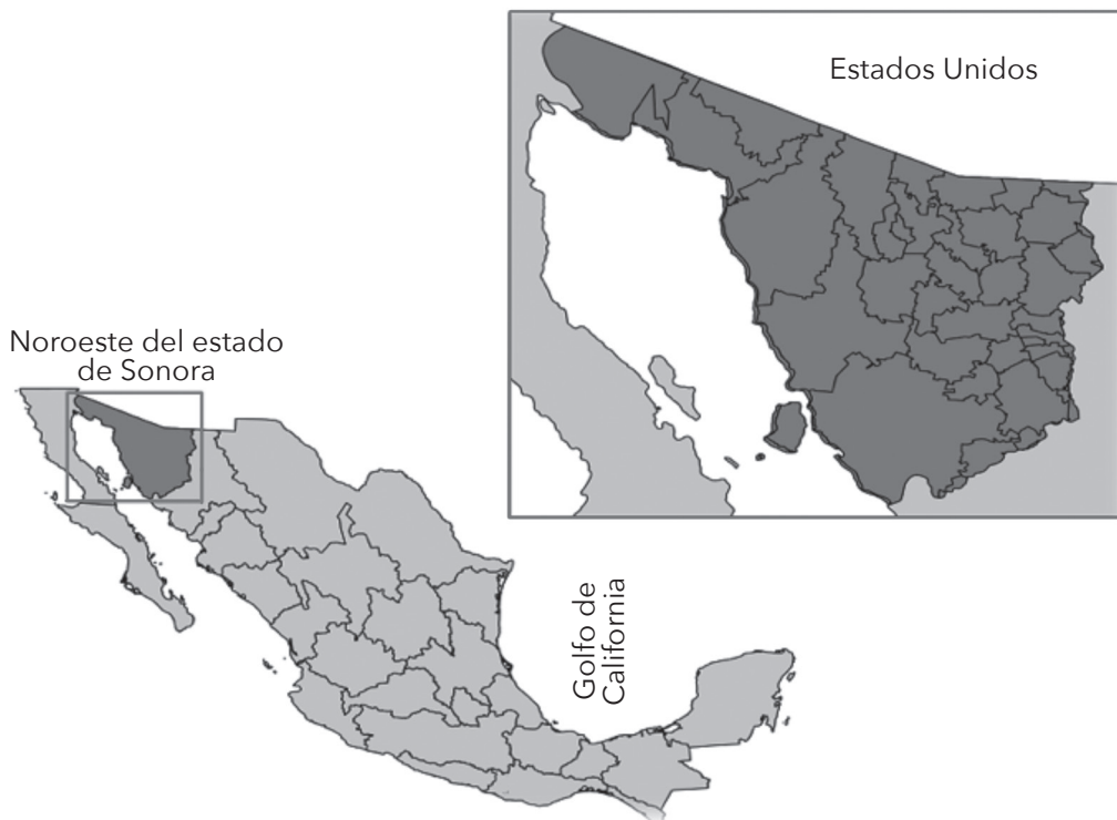
Figura 1. Territorio y división municipal de la jurisdicción del CCAN